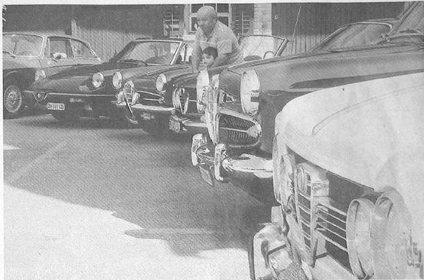
Autofans – vor allem Männer – unterschiedlicher Generationen waren fasziniert von den italienischen Bolden.

Selbstverständlich wurde auch kulinarisch einiges geboten. Pasta, Bra-