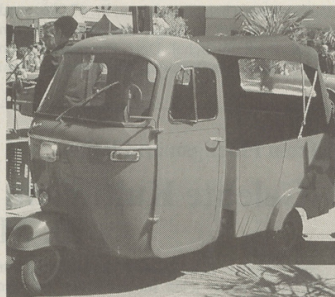
Inmitten der Italo-Klassiker-Fahrzeuge war auch eine dreirädrige Vespa ausgestellt.