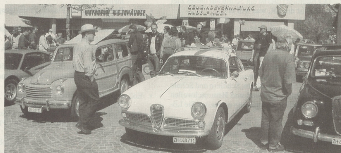
Viel Volk strömte auf den Marktplatz und interessierte sich für die ausgestellten Italo-Klassiker-Fahrzeuge.