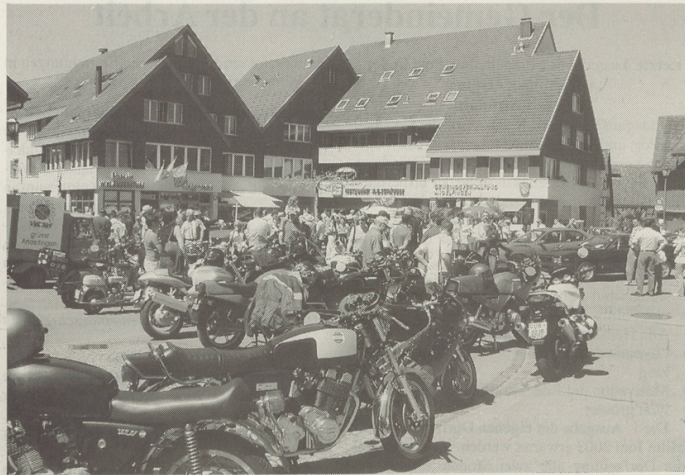
Der Laverda Club Schweiz (im Vordergrund) nahm den 1. Andelfinger Raduno als Saisonstart und erschien mit einer 25-köpfigen Delegation.

Hochkarätige Italo-Klassiker am 1. Andelfinger Raduno